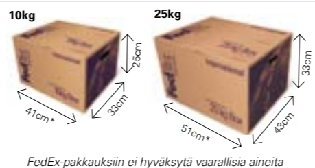
* Mitat ovat sisämittoja.

kaikille lähetyksille 10 kg tai 25 kg asti, kilpailukykyisellä kiinteällä hinnalla. FedEx® 10kg ja 25kg Box eivät ole käytössä FedEx International Economy® -palvelun kanssa.