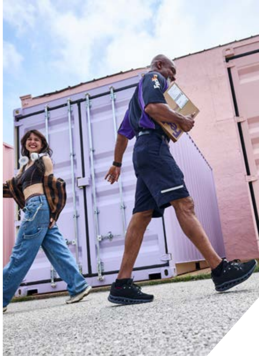
ព័ត៌មាននេះត្រឹមត្រូវ និងមានសុពលភាពត្រឹមថ្ងៃទី 30 ខែមេសា ឆ្នាំ 2026។