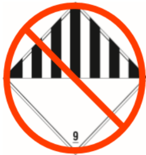
其他第九類危險物品標籤

自 2019 年 1 月 1 日起生效，第 9 類標籤不能用作 I / IA / IB 類貨物的危險物品標籤。